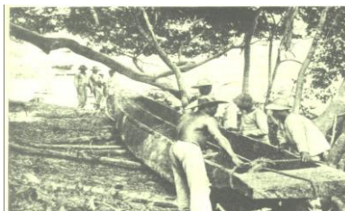
04: Registro fotográfico de uma ubá construída e colocada em uso.