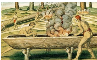
01: Imagem da confecção de uma canoa (ubá) de um só tronco.