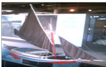
05: Fotografia de uma réplica em miniatura de uma Vigilenga (barco mestiço amazônico), registrada no Museu das Embarcações localizadas no Mangal das Garças – Belém do Pará.