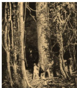
03: Registro fotográfico do corte de uma árvore para a construção de uma canoa (ubá)